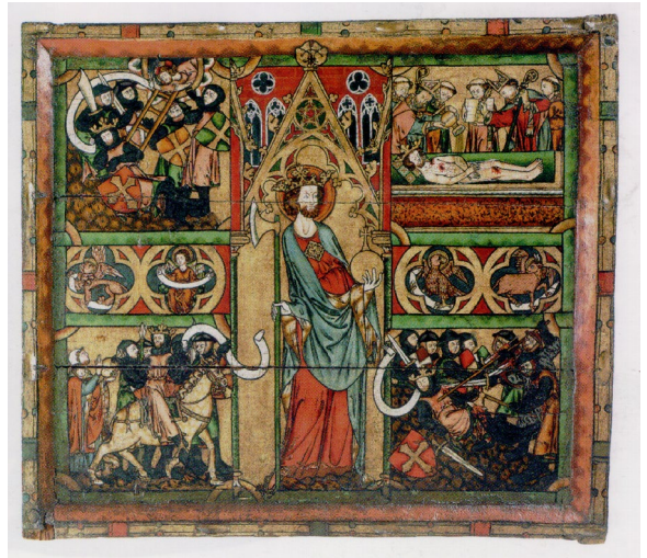
St. Olav skrinlegges. Antemensalet i Nidarosdomen.

"Til den hellige kong Olav kom det så mange mennesker at det var som en hær, halte og blinde eller folk som var syke på andre måter, og de gikk friske derfra".