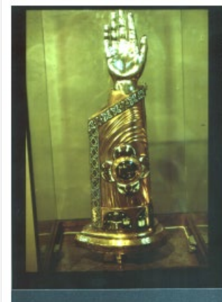
Helligdomsarmen i St. Olavs domkirke i Oslo.

Far og son me gjev vårt kvede lovar Gud av hjartans trong; lukke, signing, frygd og glede ofrar me dei tvo med song Sæle frygt, for deim og Anden me vår lovsong stå ein gong!