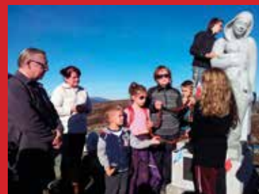
Matki Bożej biorąc w dłonie wykonany przez dzieci różaniec i odmówiliśmy wspólnie Jego jedną dziesiątkę ...