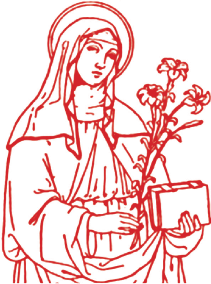
St. Klara av Assisi

Advent og jul er en tid preget av hygge, tro, gavmildhet og forventning. Men hva er det egentlig man har forventning til?