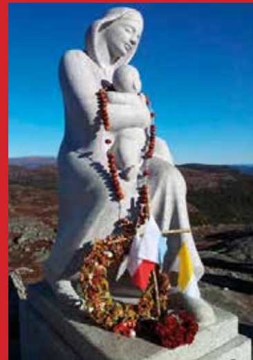
.p..r wzy dnaierszieo,n ue sftlaógp i Moraarzy ir óźźłoażny- ilaic m..

Serdecznie wszystkich zapraszamy do uczestnictwa w pielgrzymkach, gdyż są one wspaniałą ucztą duchową połączoną z obcowaniem z przyrodą i drugim człowiekiem ;-)