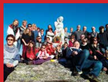
... utrwaliliśmy również naszą obecność wspólnymi zdjęciami ...